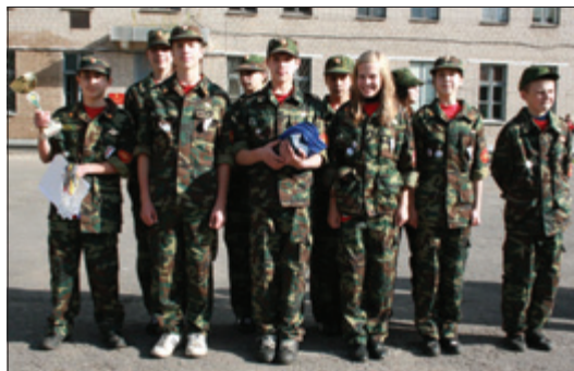
Ребята из школы №68 заняли первое место

нятия зачета по оказанию первой медицинской помощи. Медико-санитарная подготовка предполагает не только знание теоретических вопросов, но и практические навыки. И то, и другое при помощи письменных тестов и им-