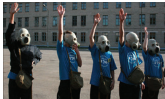
Ученики школы №176 неплохо обращаются со средствами индивидуальной защиты