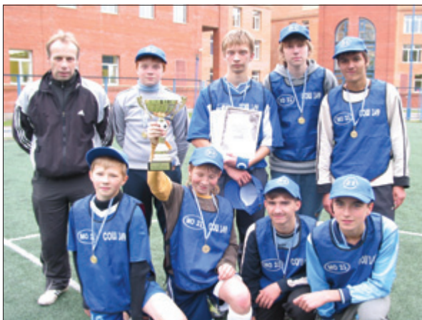
В старшей возрастной группе I место заняла школа №149