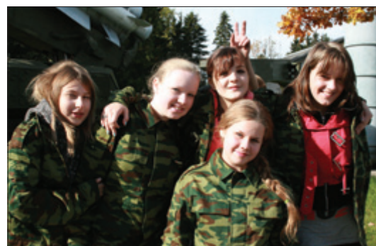
Девчонки из лицея №179 передают привет мальчишкам из своей команды