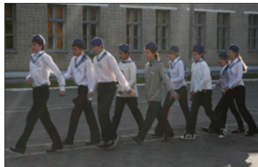
На втором месте оказались ученики школы №149