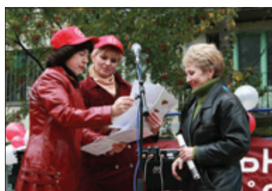
Вручение грамот и ценных призов