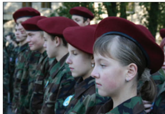
Ученики школы №89 в строю

"Смотри, глаза ей не забинтуй!" - говорит один мальчуган другому, переживая за свою команду во время при-