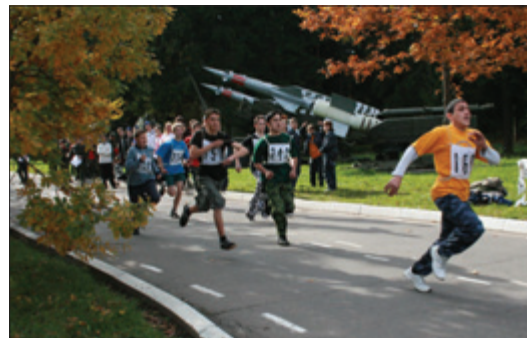
На фото впереди командир команды школы №175

Особую благодарность хочется выразить военнослужащим войсковой ча-