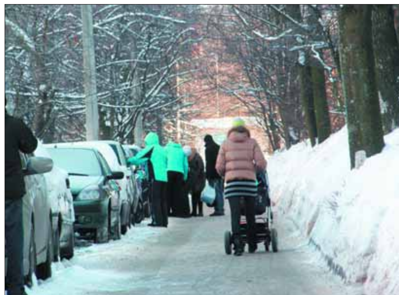
Жителям дома по Гражданскому пр., 117/4 повезло: снег и лед не страшны, когда дворник работает на совесть!

Мне кажется, что поведение людей зависит от того, что их окружает: чем красивее двор, тем культурнее ведут себя