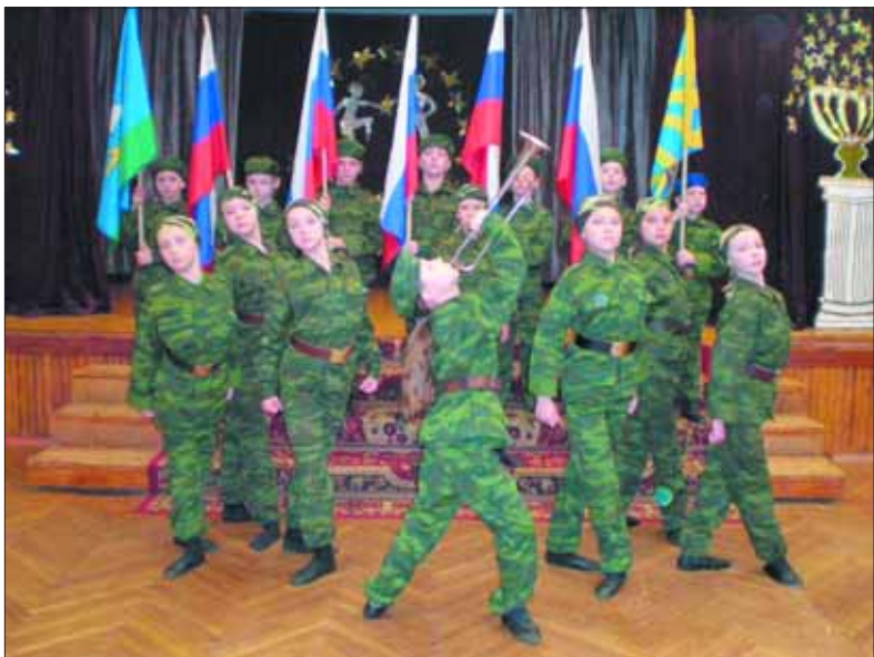
«Россия молодая», хореографический коллектив 89 школы нашего округа. Лучшие традиции патриотизма есть кому продолжать.