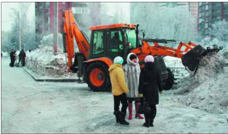
Вывезти 80 кубометров снега? Без техники тут не обойтись. Депутатам решить вопрос помогли энтузиазм и дипломатия.

Многочисленные обращения жителей округа с просьбами навести порядок поступили к депутату Муници-