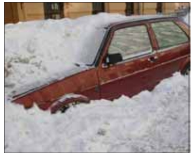
Владельцы автомобилей-сугробов сначала получают письменное предписание – напоминание о необходимости соблюдать закон.

сийской Федерации за неуплату штрафа в установленный срок предусмотрена административная ответственность в виде удвоения штрафа либо административного ареста до 15 суток (ст. 20.25 Кодекса об Административных правонарушениях).