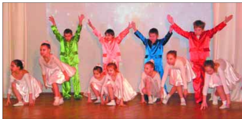
На сцене – танцевальный коллектив «Кристалл». Уметь выразить свои эмоции в движении – это тоже счастье!

Мы стараемся в нашей школе поддерживать особую атмосферу, оптимальный климат, в котором хорошо и детям, и взрослым. Согласитесь, чем больше вокруг гармоничных, разумных, духовно развитых людей, тем больше света на Земле будет».