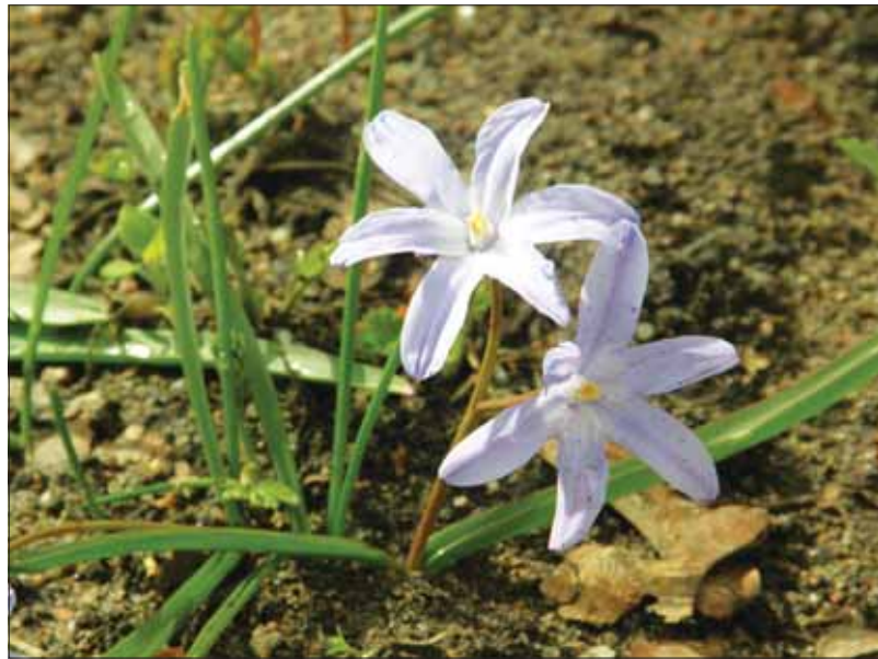
Во дворе на Гражданском, 117 уже распустились первоцветы

- Совсем недавно на субботники выходило по 40 человек, нам казалось, еще чуть-чуть - и будет вокруг только красота. Но собак на клумбах, окурков в цветниках, мамочек с банками пива на лавочках не становится меньше. В ответ на