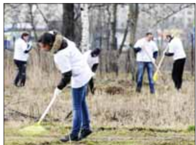
В пойме Муриноского ручья работали добровольцы из НКП «Региональное «Объединение».