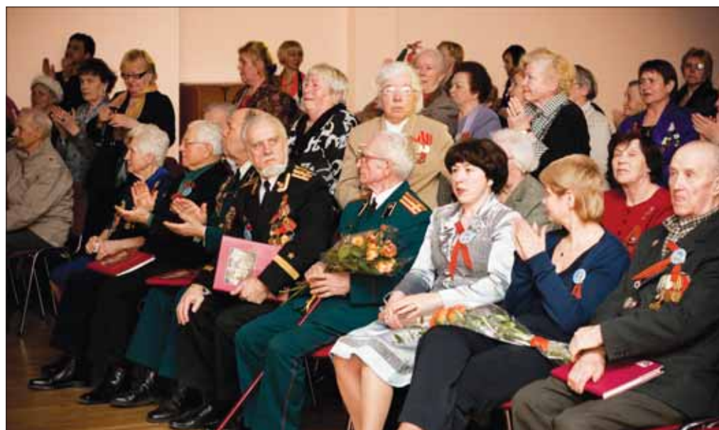
В зале собрались авторы и члены редколлегии книги воспоминаний о войне и Победе