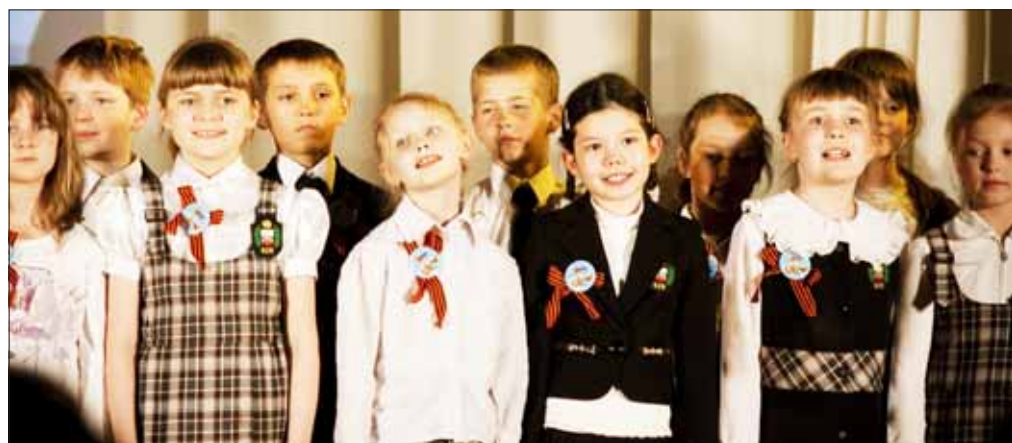
Учащиеся 619 школы подготовили для ветеранов концерт