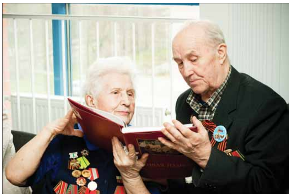
Ветераны получили авторские экземпляры книги «Живая память»

Некоторые истории из книги «Живая память» вы можете прочитать на стр. 4-5 нашей газеты.